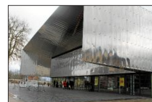
Ce soir à la salle des fêtes de Rodez

la moralisation de la vie publique, la mouvance invite aussi à la réflexion : pourquoi polariser le débat sur les divergences des uns et des autres, sur les divisions des tendances alors qu'il existe une possibilité commune sur les convergences d'idées qu'elles viennent de la droite comme de la gauche ? Le mouvement mise sur un potentiel travail des accords sans renier les différences propres à l'identité politique de chacun. Tout ça avance une nouvelle vision de la pratique de la politique. Le candidat Macron pense que l'on ne peut pas continuer à se condamner aux usages longtemps imposés par l'affrontement des deux clivages majeurs de l'échiquier politique Français. Ce soir, la sensibilité macroniste invite les Aveyronnais pour un meeting qui attirera sûrement les curieux et autres soucieux de la notion démocratique du débat. Hormis les programmes, une année électorale présidentielle reste, quoi qu'en fasse, un tournant de l'histoire politique de l'état qui s'y subor-