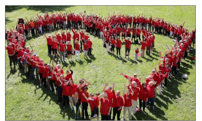
Le Parcours du cœur aura lieu dimanche, à l'initiative de la Ville et des deux associations Cœur diabète amitié et Cœur santé Avignon.

danse country et de qi gong. 13 h , buffet sportif offert par Cœur santé Avignon et Cœur diabète Amitié.