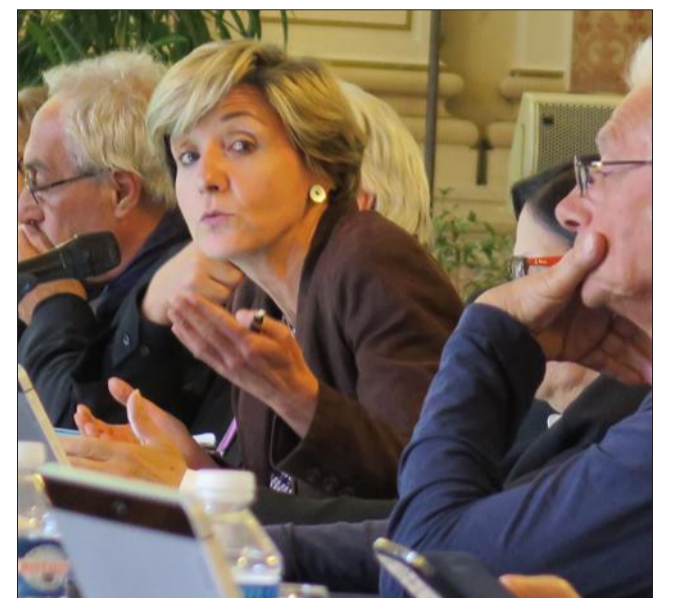
La délibération portant sur l'acquisition des Bains Pommer a été adoptée à l'unanimité lors du conseil municipal.

Quant aux Bains, les installations techniques et le jardin, ils sont voués à devenir un musée dévoilant au public les pratiques hygiénistes du début du XX e .